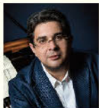
ファルカシュ・ガーボル (ピアノ)