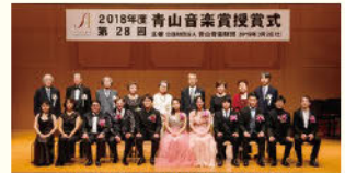
第28回青山音楽賞授賞式より

青山音楽記念館 バロックザールで開催される授賞式では、選考委員の投票と審査委員の最終審議により選ばれた受賞者へ、賞状、トロフィー、賞金が贈られます。また、受賞者による演奏も行われます。開催日程につきましてはホームページをご確認ください。