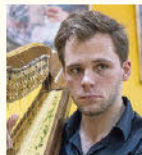
サーシャ・ポルダチョフ (ハープ)