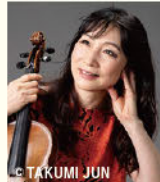
© TAKUMI JUN 山本 由美子 (ヴィオラ)