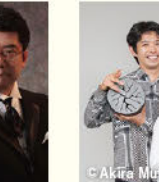
© Susumu Sasaki 佐藤 卓史 (ピアノ)