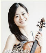
© Akira Grito 荒井 優利奈 (ヴァイオリン)